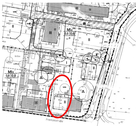
Auszug aus dem Bebauungsplan

Die Bebauung richtet sich nach dem rechtskräftigen Bebauungsplan „Frentzel-, Friedrichsstraße, Bleichgäßchen“. Das Bauungs- sowie das Nutzungskonzept sind vor Abschluss des Kaufvertrages mit der Stadt Hoyerswerda abzustimmen.