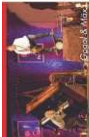
Eppl & Marx