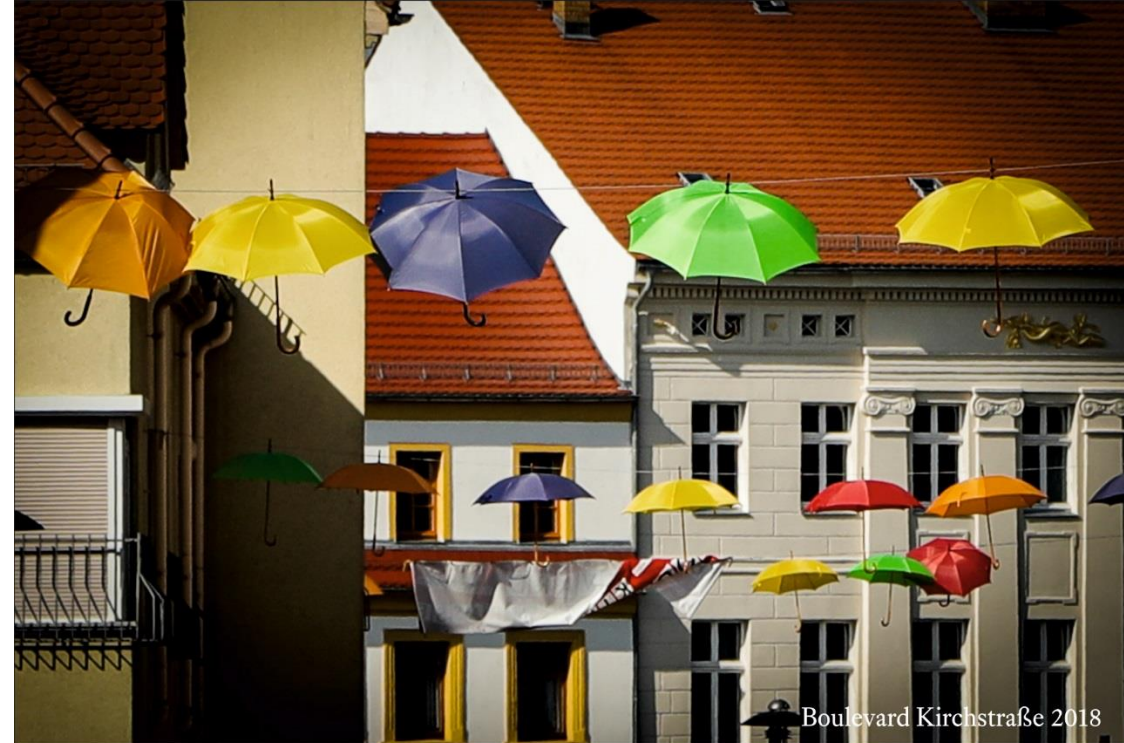
Boulevard Kirchstraße 2018