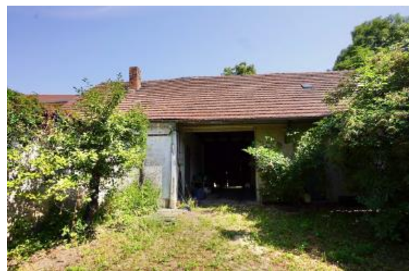
Wirtschaftsgebäude mit Durchfahrt und Ausgedinge