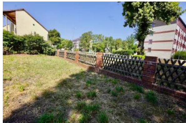
hinterer Gartenbereich zur Alten Berliner Straße