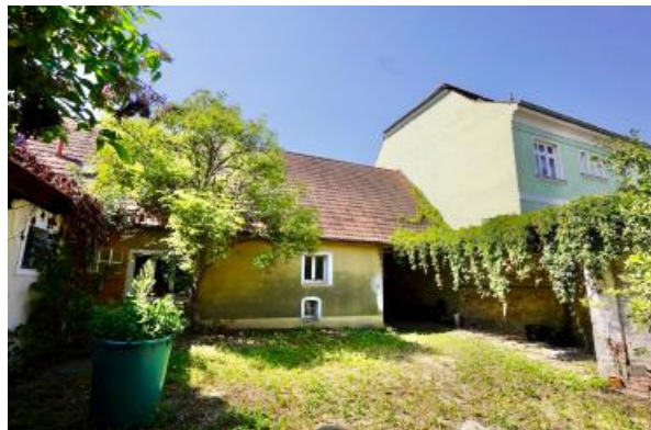
Hofansicht Wohnhaus, rechts Durchfahrt