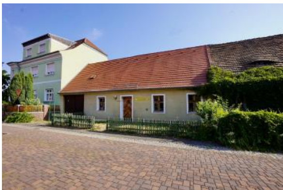
Straßenansicht Wohnhaus Am Haag 2

❖ Weiterhin wird darauf verwiesen, dass im Rahmen des Grundstücksverkaufs, im Anschluss an die Beschlussfassung des Stadtrates bzw. Verwaltungsausschusses, der Erwerberkaufpreis und der Nutzungszweck des Grundstückes namens- und identitätsbezogen bekanntgegeben werden.