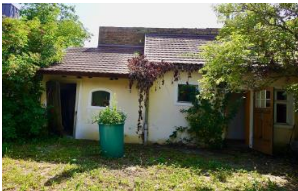
Seitenflügel mit angrenzendem Nebengebäude