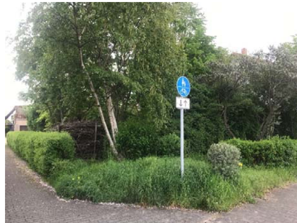
Blick von Dorfstraße auf das Grundstück