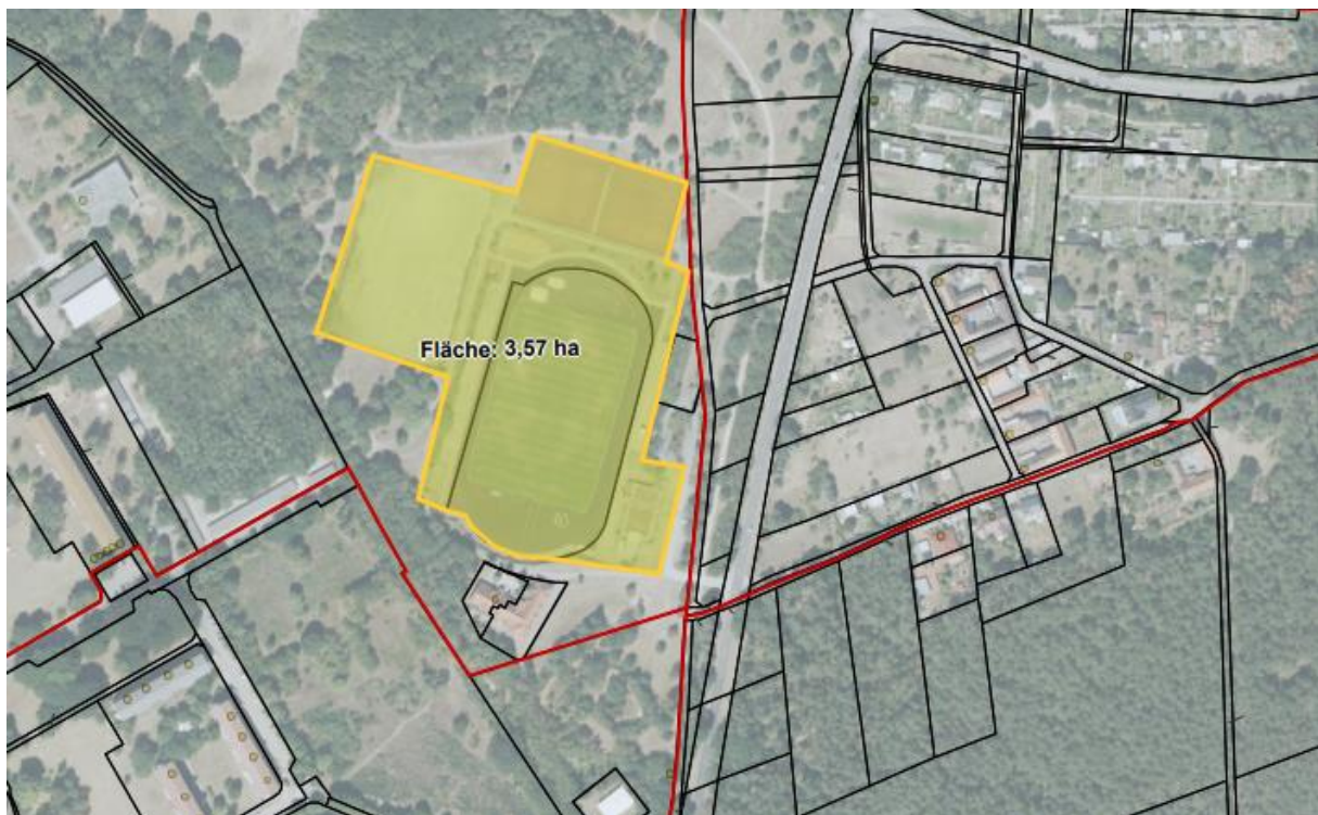
Luftbild mit eingezeichneter Pachtfläche

Die zukünftige Pachtfläche beträgt ca. 3,57 Hektar.