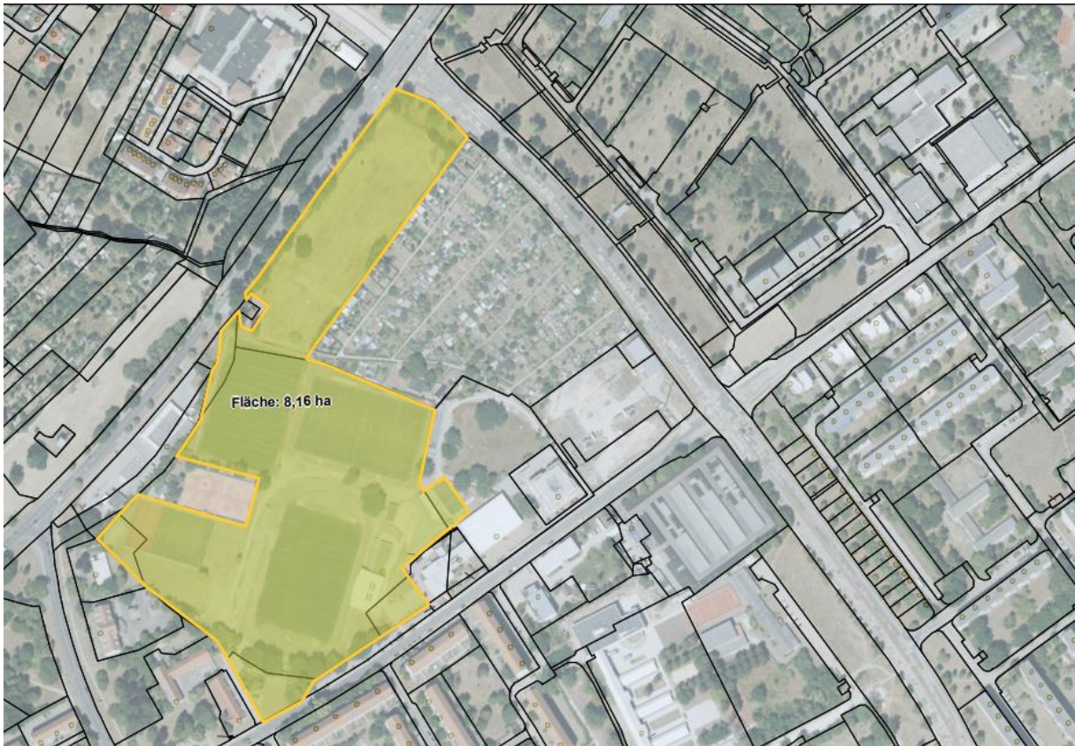
Luftbild mit eingezeichneter ungefähre Pachtfläche