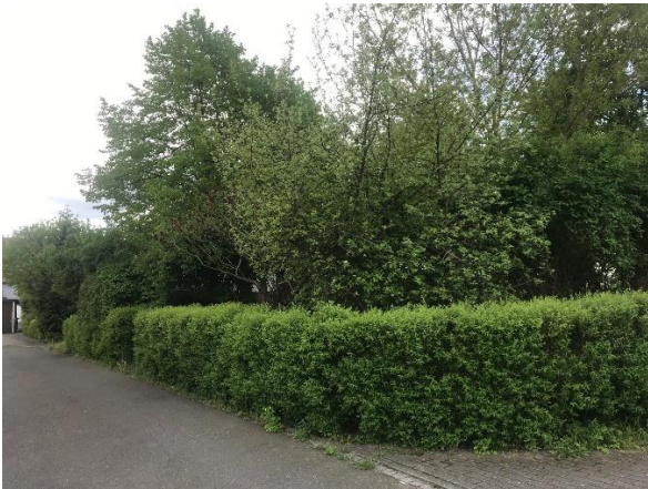
Blick von Krabatweg auf das Grundstück

❖ Vorsorglich wird darauf hingewiesen, dass es sich bei der öffentlichen Ausschreibung von Grundstücken der Stadt Hoyerswerda um ein Verfahren handelt, das mit der gleichnamigen Vergabe- und Vertragsordnung für Bauleistung (VOB) und der Verdingungsordnung für Leistungen – ausgenommen Bauleistungen - (VOL) nicht vergleichbar ist. Die öffentliche Ausschreibung ist eine an einen unbestimmten Personenkreis gerichtete, für die Stadt Hoyerswerda unverbindliche Aufforderung zur Abgabe von Kaufangeboten.