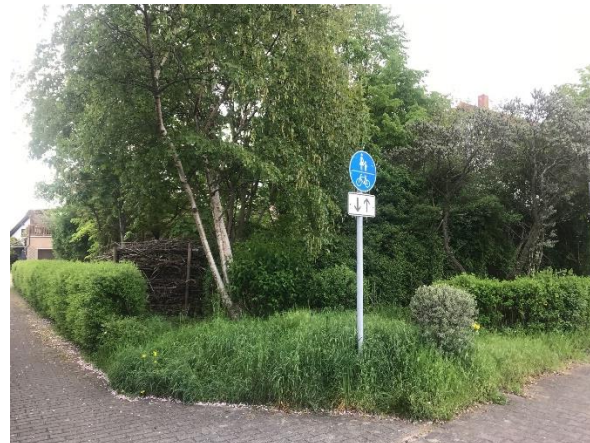
Blick von Dorfstraße auf das Grundstück