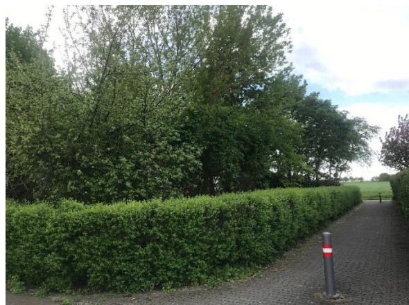
Blick auf nördliche Grenze mit anliegendem Weg