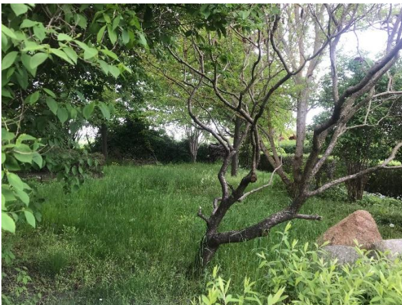
Blick in das Grundstück