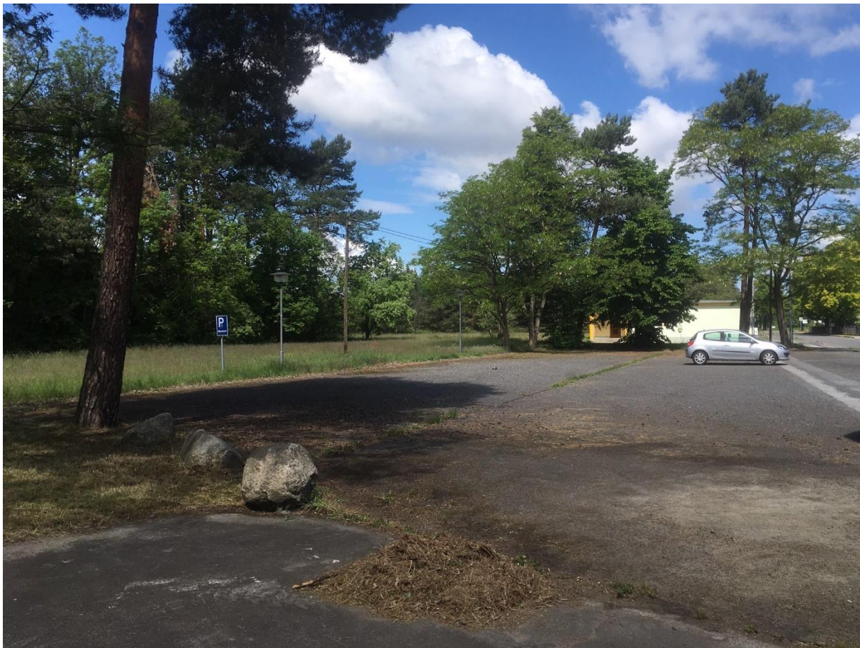
Blick auf Grundstück im Wohngebiet Ernst-Thälmann-Straße mit Saunagebäude im Hintergrund

❖ Vorsorglich wird darauf hingewiesen, dass es sich bei der öffentlichen Ausschreibung von Grundstücken der Stadt Hoyerswerda um ein Verfahren handelt, das mit der gleichnamigen Vergabe- und Vertragsordnung für Bauleistung (VOB) und der Verdingungsordnung für Leistungen – ausgenommen Bauleistungen - (VOL) nicht vergleichbar ist. Die öffentliche Ausschreibung ist eine an einen unbestimmten Personenkreis gerichtete, für die Stadt Hoyerswerda unverbindliche Aufforderung zur Abgabe von Kaufangeboten.