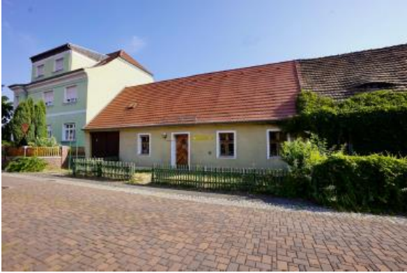
Straßenansicht Wohnhaus Am Haag 2