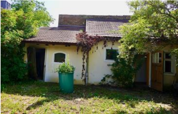
Seitenflügel mit angrenzendem Nebengebäude