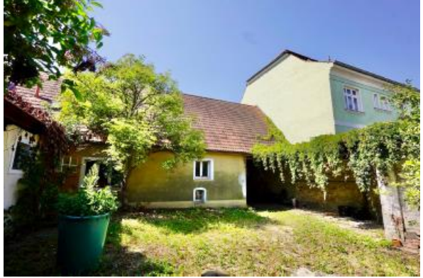
Hofansicht Wohnhaus, rechts Durchfahrt