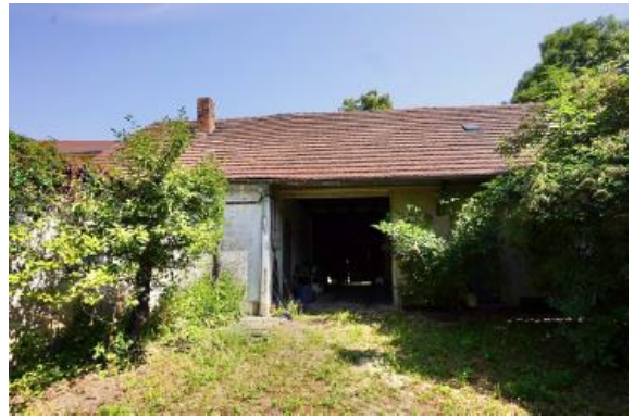
Wirtschaftsgebäude mit Durchfahrt und Ausgedinge