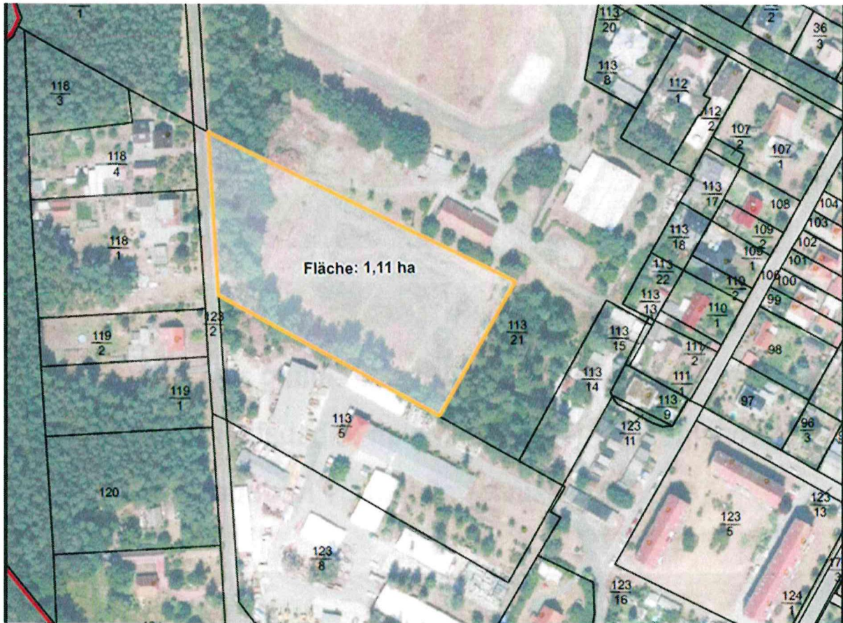
Luftbild mit eingezeichneter Pachtfläche