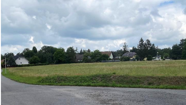
Blick in Richtung westliche Wohnbebauung

Die Baufläche befindet sich im Geltungsbereich des Bebauungsplanes „Bröthener Straße“. Eine Bebauung hat sich nach den Festsetzungen des rechtskräftigen Bebauungsplanes zu richten.