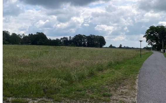
Blick in Richtung Osten