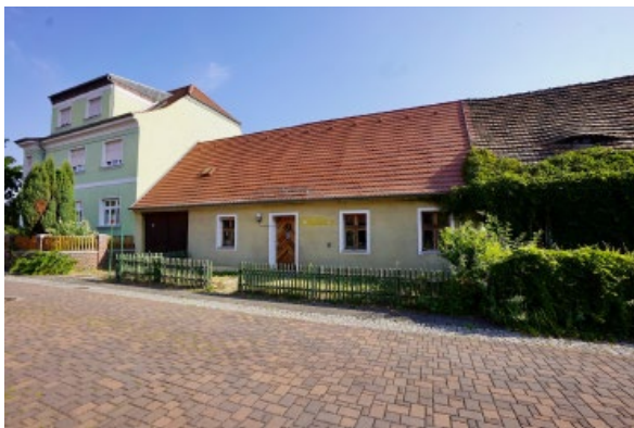
Straßenansicht Wohnhaus Am Haag 2

❖ Weiterhin wird darauf verwiesen, dass im Rahmen des Grundstücksverkaufs, im Anschluss an die Beschlussfassung des Stadtrates bzw. Verwaltungsausschusses, der Erwerbserkaufpreis und der Nutzungszweck des Grundstückes namens- und identitätsbezogen bekanntgegeben werden.