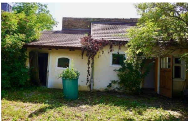
Seitenflügel mit angrenzendem Nebengebäude