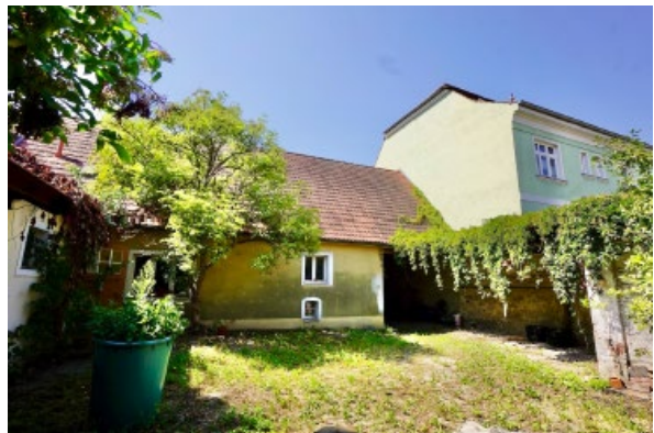
Hofansicht Wohnhaus, rechts Durchfahrt