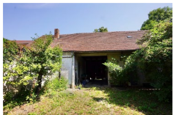
Wirtschaftsgebäude mit Durchfahrt und Ausgedinge