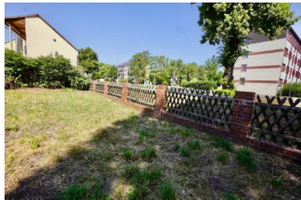
hinterer Gartenbereich zur Alten Berliner Straße