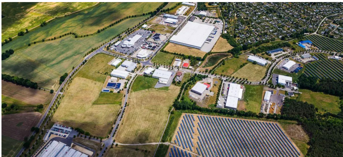
Luftbild Gewerbegebiet Hoyerswerda-Nardt