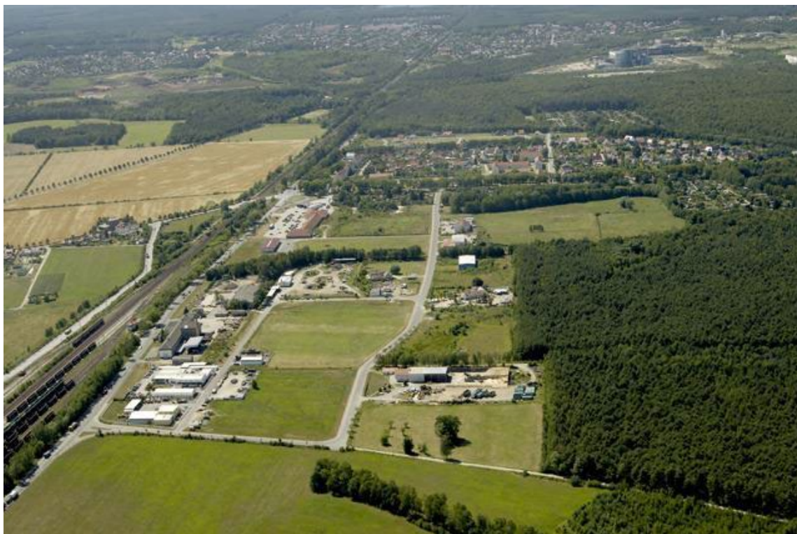
Luftbild Gewerbegebiet Hoyerswerda-Schwarzkollm