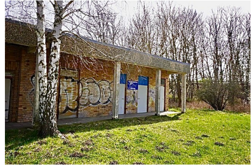
Außenansichten vom Gebäude