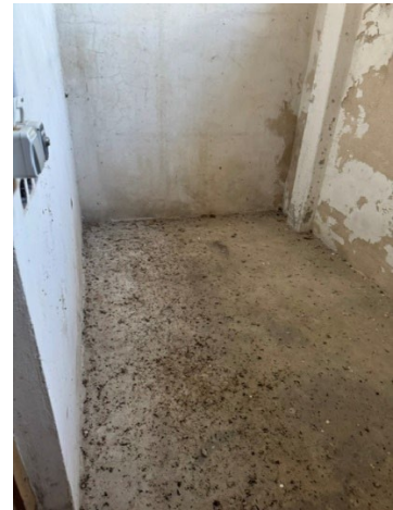
Innenansichten vom Gebäude