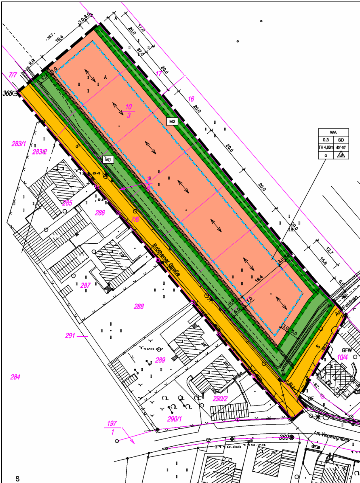
Bebauungsplan „Bröthener Straße / Am Feldrain“ Ortsteil Dörghenhausen - Stadt Hoyerswerda Rechtsplan April 2008